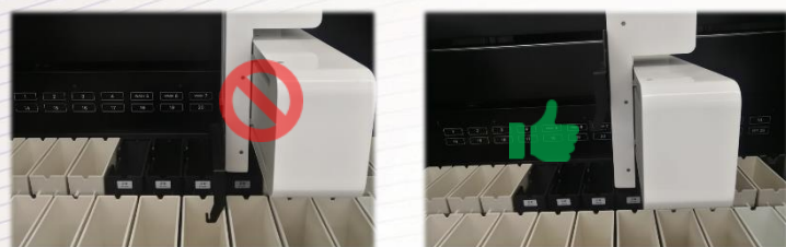
提起挂钩再移动机械臂，防止撞弯挂钩