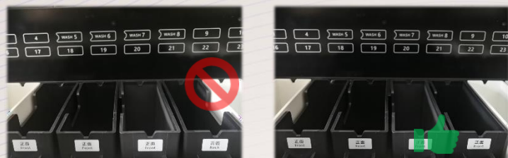
试剂缸务必放置平齐